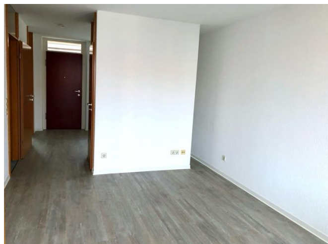
Blick über den Flur ins Wohn – und Esszimmer / Blick zurück in den Flur