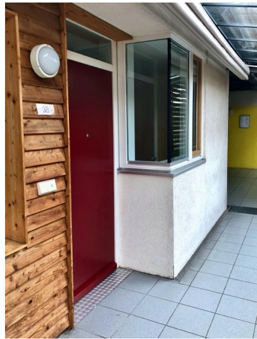
Eingangsbereich zur Wohnung