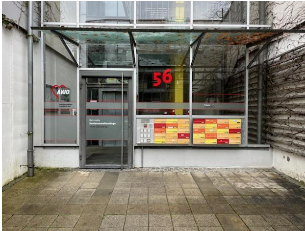
Treppenhaus von außen